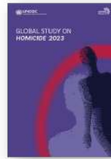
Global Study on Homicide 2023