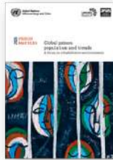
Prison Matters: Global prison population and trends. July 2025