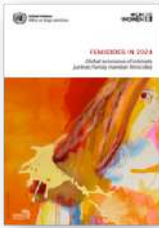
Femicides in 2024: Intimate partner/family member femicides. November 2025